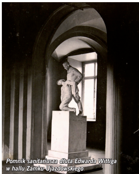
Pomnik sanitariusza dłuta Edwarda Wittiga w hallu Zamku Ujazdowskiego