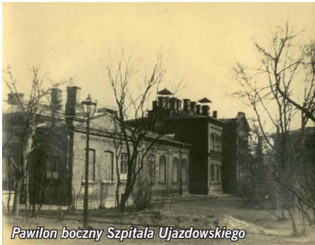
Pawilon boczny Szpitala Ujazdowskiego