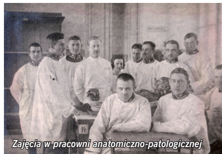
Zajęcia w pracowni anatomiczno-patologicznej

kład Rentgenowski, a także pracownice, w których odbywały się ćwiczenia: anatomiczno-patologiczną, chemiczno-higieniczną, bakteriologiczną i badań klinicznych.