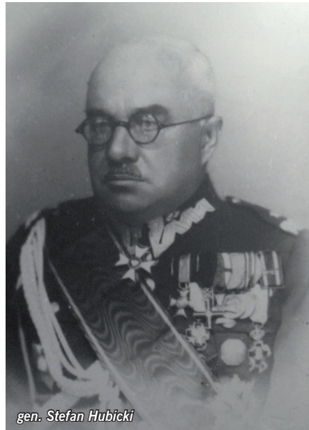
gen. Stefan Hubicki

Szpital Szkolny spełniał jak na tamte czasy bardzo wysokie standardy. Liczba łóżek etatowych wynosiła 600. W skład kompleksu szpitalnego wchodziły następujące oddziały: wewnętrzny, dziecięcy, chirurgiczny, ginekologiczny, położniczy, nerwowy, psychiatryczny, uszny i gardłany oraz przychodnia dentystryczna. Szpital Ujazdowski posiadał również Za-