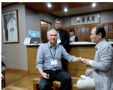
Fot. 1. Lekarz Tradycyjnej Medycyny Koreańskiej demonstruje lekarzowi medycyny zachodniej możliwości diagnostyczne tradycyjnego badania tętna i pulsu

wa. Współistnienie obu rodzajów medycyny zostało tam wypracowane w trakcie długich dyskusji społecznych na różnych forach, także w parlamencie. Dyskusje te nieraz były burzliwe, bo ścierały się poglądy kadr medycznych, głównie lekarzy, wykształconych w tzw. współczesnym systemie medycznym, który powstał w Europie i Ameryce, oraz tej części środowisk medycznych, która akceptowała odmienną tradycyjną medycynę orientalną, jej wartości terapeutyczne, metody diagnostyczne oraz indywidualne podejście do pacjenta w zakresie leczenia.