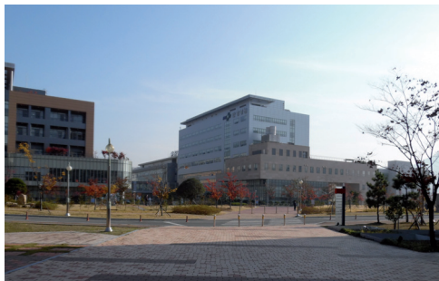
Fot. 5. Szpital Uniwersytecki TKM w Pusan

Szkoła Tradycyjnej Medycyny Koreańskiej Uniwersytetu w Pusan powstała w 2008 r. jako pierwsza narodowa instytucja zajmująca się TKM. Studia obejmują rok interny i 3 lata w wyznaczonych szpitalach (klinicznych) na 8 kierunkach: ginekologicznym, pediatrycznym, neuropsychiatrycznym, akupunktury i moksy, medycyny wewnętrznej, dermatologii, okulistyki, rehabilitacji, medycyny konstytucyjnej Sasang.