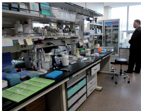
Fot. 9. Laboratoria standardów medycyny tradycyjnej KIOM)

Działalność badawcza obejmuje trzy działy tematyczne: Dział Badań Medycznych, Dział Badawczy Leków Ziołowych (Zielarstwa), Dział Badawczy Kultury Medycznej i Informatyki oraz dwa ośrodki celowe: Ośrodek Standardów Medycyny Koreańskiej i Ośrodek Badawczy Polityki Medycyny Koreańskiej.