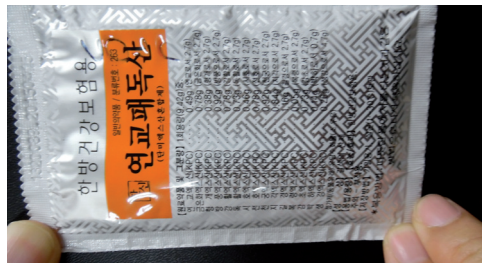
Fot. 7. Przykład popularnej mieszanki ziołowej przepisywanej w przychodni miejskiej

Koszyk świadczeń obejmuje także refundację 56 tradycyjnych receptur zielarskich i wyciągów z pojedynczych ziół.