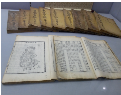
Fot. 2. Wizerunek narządów trzewnych i jelit człowieka w starych księgach medycznych (w zbiorach KJOM)

TKM wywodzi się z tradycyjnej medycyny chińskiej. Najstarsze dzieła oparte były na klasycznych podstawach medycyny chińskiej z epoki tzw. Żółtego Imperium (Dynastia Han; I wiek n.e.). Z tamtych czasów mają wywodzić się metody akupunktury i moksy, teoria Yin-Yang, teoria pięciu elementów, teoria pięciu narządów trzewnych i sześciu jelit, podstawy ziołolecznictwa i terapii naparami, medytacja i stosowanie masażu w celach leczniczych.