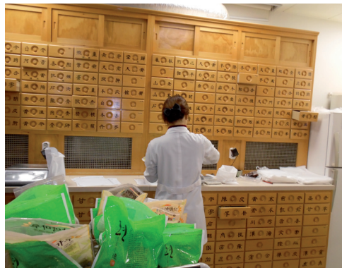
Fot. 4. Wnętrze apteki TKM z charakterystycznymi gabinetami

Obecnie kadry medyczne Korei Południowej obejmują ok. 20 000 lekarzy TKM, 26 000 farmaceutów wykształconych w zakresie farmacji „zachodniej” i medycyny ziołowej, 1700 farmaceutów ziołowych i 100 dyspenserów zielarskich. Istnieje ok. 200 szpitali i 12 000 przychodni TKM.