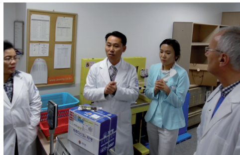
Fot. 8. Zestaw leków przygotowany przez prywatną klinikę dla wypisywanego pacjenta

W prywatnych klinikach stosujących TKM pacjenci zaopatrywani są w leki ziołowe wytwarzane w aptekach, które często są przemysłowymi laboratoriami farmaceutycznymi, wytwarzającymi zindywidualizowane leki dla poszczególnych pacjentów na cały okres terapii. Leki takie nie są refundowane.