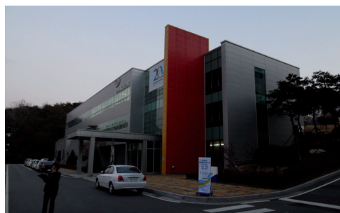
Fot. 10. Laboratorium badań fizjologicznych podstaw akupunktury

Drugim zakresem badań są obserwacje typów Sasan, gdzie gromadzone są dane od pacjentów i opracowywany jest Sasang Health Index.